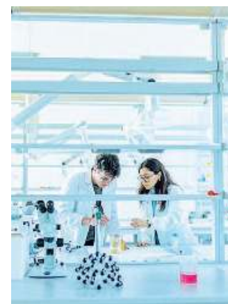
In laboratorio. Studenti del Liceo Carli alla prova pratica

■ Il Liceo internazionale per l'impresa Guido Carli propone tre percorsi principali: il Liceo scientifico quadriennale, il Liceo scientifico con opzione Scienze applicate quinquennale e il Liceo delle Scienze Umane con opzione economico-sociale quinquennale. Al fine di agevolare gli studenti nella scelta del percorso più adatto, il Carli offre un programma di orientamento, che inizia con sessioni di incontri individuali, prenotabili quotidianamente secondo la formula «Every day is an open day». A seguito di questi incontri, sono previste attività di open stage che si terranno direttamente nelle aule nei giorni