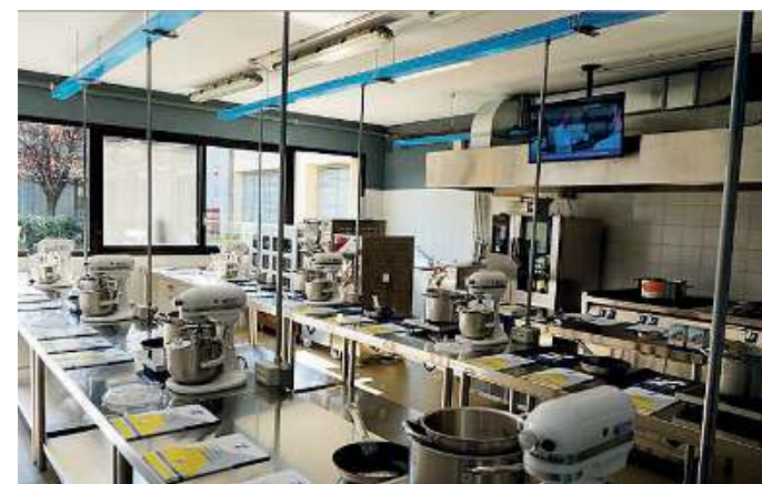
Alla prova. Un'ampia cucina con le postazioni per gli aspiranti cuochi