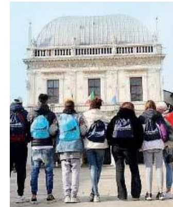
Insieme. Un gruppo di studenti di Scuola Bottega a Brescia