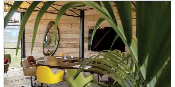
Dove. La sede è in via Reggio a Brescia