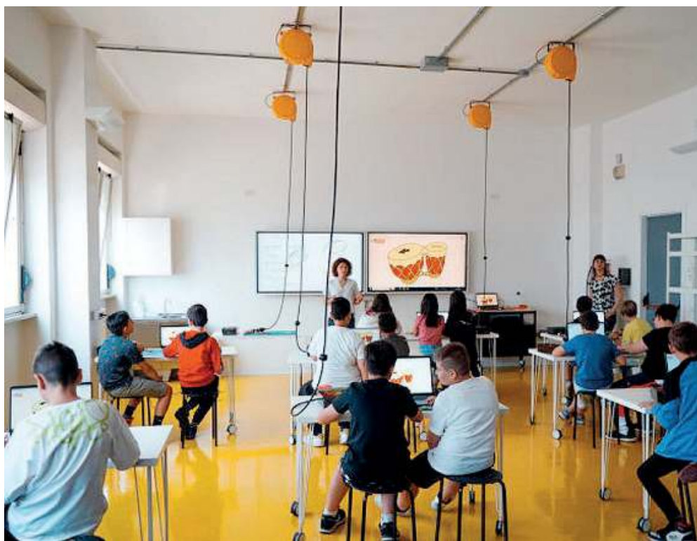
In aula. Studenti del Cfp Zanardelli durante una lezione