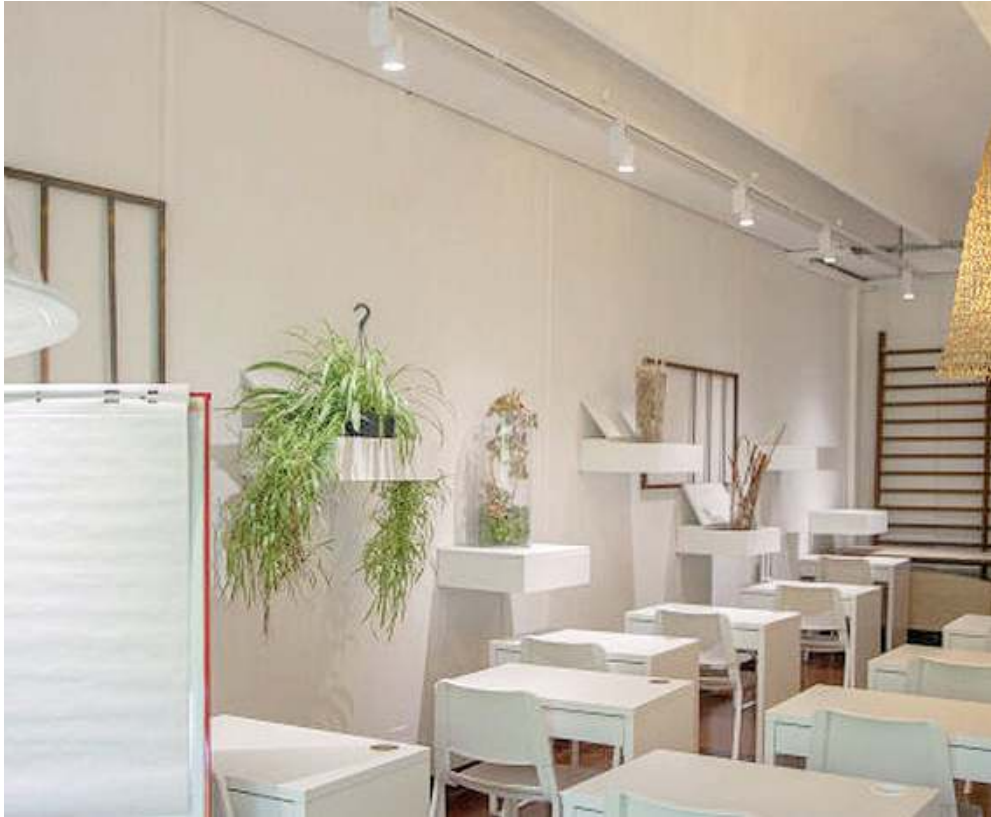
A lezione. Un'aula della Ok School Academy pronta per accogliere gli allievi